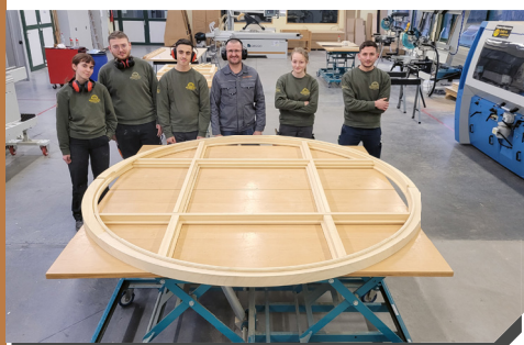
Formations en centres de technologies avancées