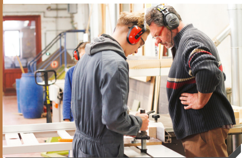
Projets concrets sur chantiers