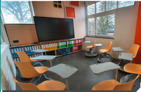
Salle commune + TBI