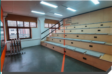
Gradins + TBI + Casiers individuels

UNIQUEMENT EN 1 re pour la rentrée scolaire 2026