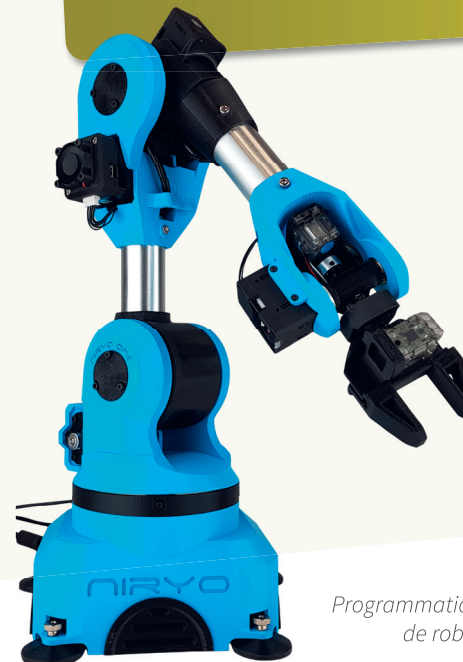
Programmation de robot