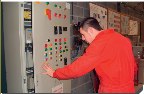
Armoire de commande industrielle