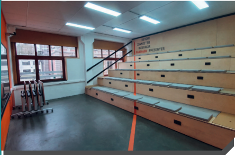
Gradins + TBI + Casiers individuels