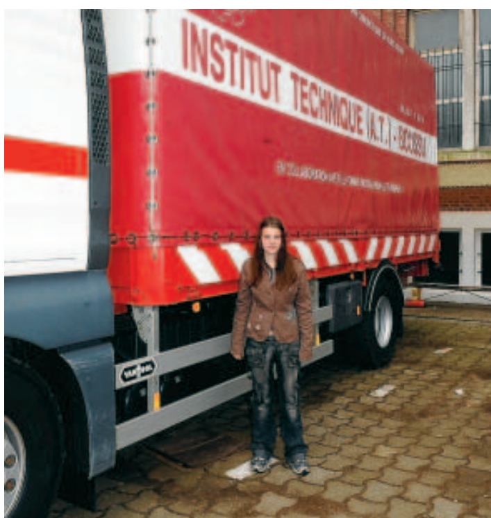
Elles ne sont que deux filles à suivre cette formation.

tier très instable où il n'y a pas beaucoup d'avenir. Ici, je vais pouvoir faire des projets. Et puis, c'est plus facile pour trouver un emploi." Et d'ajouter: "C'est vrai que j'ai toujours fait des choix sur-